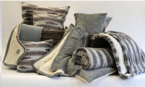
Kuscheliges Fellimitat: Decken und Kissen aus der Deckenkunst Manufaktur sind bei 30 Grad waschbar.

exklusive Kleinstserien, die mit großer Sorgfalt und ganz viel Leidenschaft entstehen, betont sie.