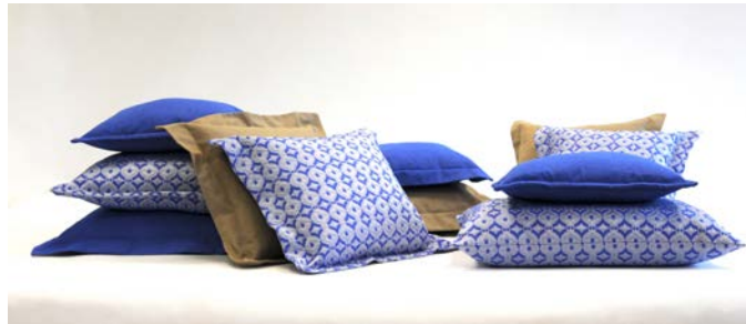
Zu den Sommerkissen, hier aus der Serie „Sylt“, werden 2015 auch passende Sommerdecken kreiert.