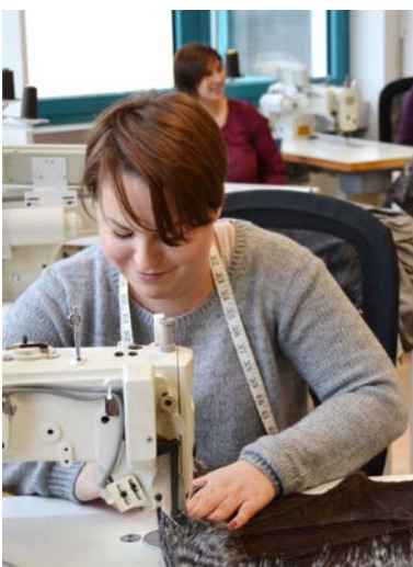
Reine Handarbeit: Die verarbeiteten Materialien können nach dem Baukastensystem individuell zusammengestellt werden.