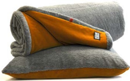
Mit den Decken und Kissen (hier Fellimitat Kaninchen/Safran) lassen sich auch farbliche Akzente setzen.